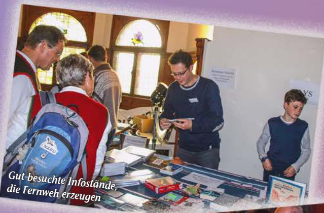
Gut besuchte Infostände, die Fernweh erzeugen