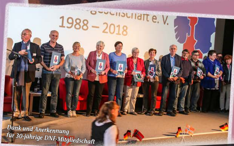
Dank und Anerkennung für 30-jährige DNF-Mitgliedschaft