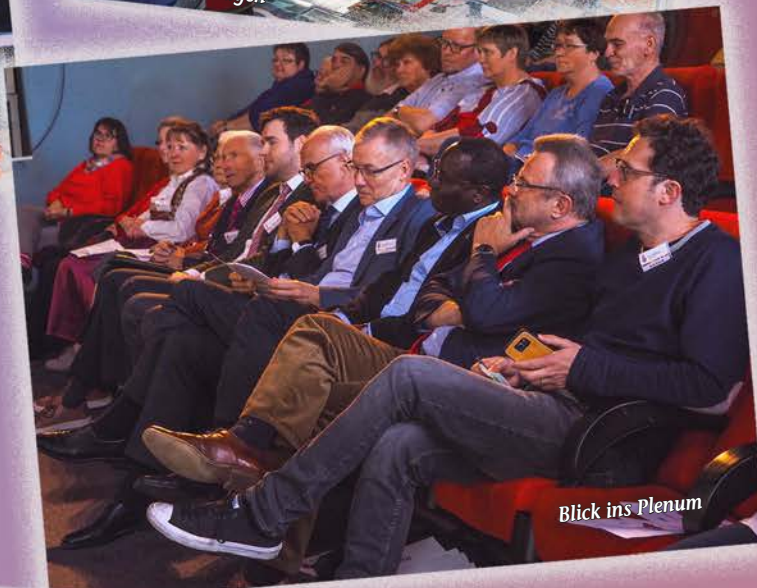
Blick ins Plenum