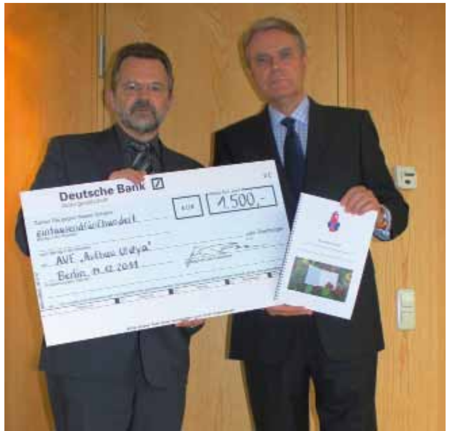
Der 1. Vorsitzende der Deutsch-Norwegischen Freundschaftsgesellschaft überreicht einen symbolischen Scheck über 1500,- Euro und das Kondolenzbuch

Norwegen wird damit nicht restriktiv auf die furchtbaren Anschläge reagieren, sondern weiter für eine lebendige Demokratie stehen. Dazu gehört auch, dass die Insel Utøya weiterhin