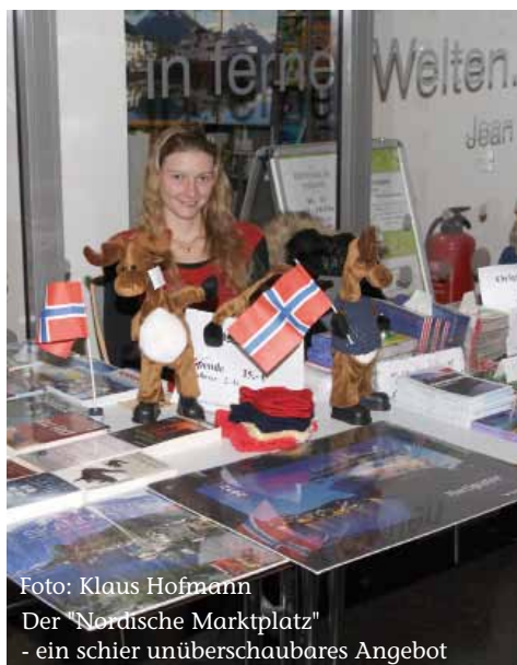
Der "Nordische Marktplatz" - ein schier unüberschaubares Angebot

Dieses Motto stand über dem vielfältigen Veranstaltungsangebot der DNF-Regionalgruppe Franken/Oberpfalz am Samstag, dem 29. Oktober 2011. Den Auftakt des umfangreichen Programms machte der Nürnberger Seemannschor. Mit seinem Liedgut vom Leben auf dem Meer löste er auch beim letzten Zuhörer Fernweh aus. Die beiden scheinbar recht unterschiedlichen Bilderpräsentationen "Nordkap - nein danke" und "Mit dem Motorrad zum Nordkap" zogen in ihren Bann. Jede zeigte auf ihre Weise die Faszination Nordeuropas. Eingestreut zwischen den Darbietungen sorgten Lesungen skandinavischer Kurzkrimis für kleine Nervenkitzel.