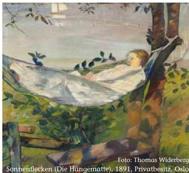
Sonnenspecken (Die Hängematte), 1891, Privatbesitz, Oslo

Jahre 1886. Ihr dort gezeigtes Bild „Am Kristianiafjord“ (Japanische Laternen), welches eine in Gedanken versunkene, im Türrahmen sitzende und auf eine Seelandschaft blickende Frau