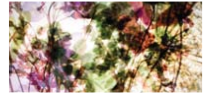
Stabbursdalen / Knivskjellodden