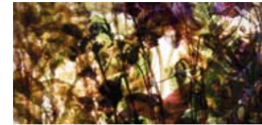
Stabbursdalen / Trollholmsund