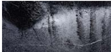
61°33'5" N / 7°53'33" E