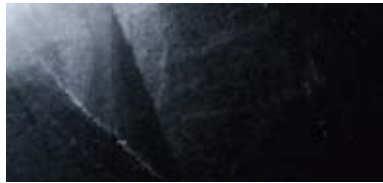
71°11'9" N / 25°40'37" E