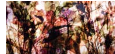
Trollholmsund / Stabbursdalen