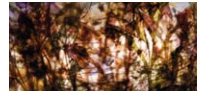
Trollholmsund / Knivskjellodden