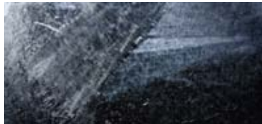
70° 6'24" N / 24°55'22" E