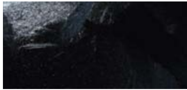
71° 6'47" N / 25°49'48" E