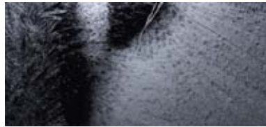
71° 8'27" N / 25°39'39" E